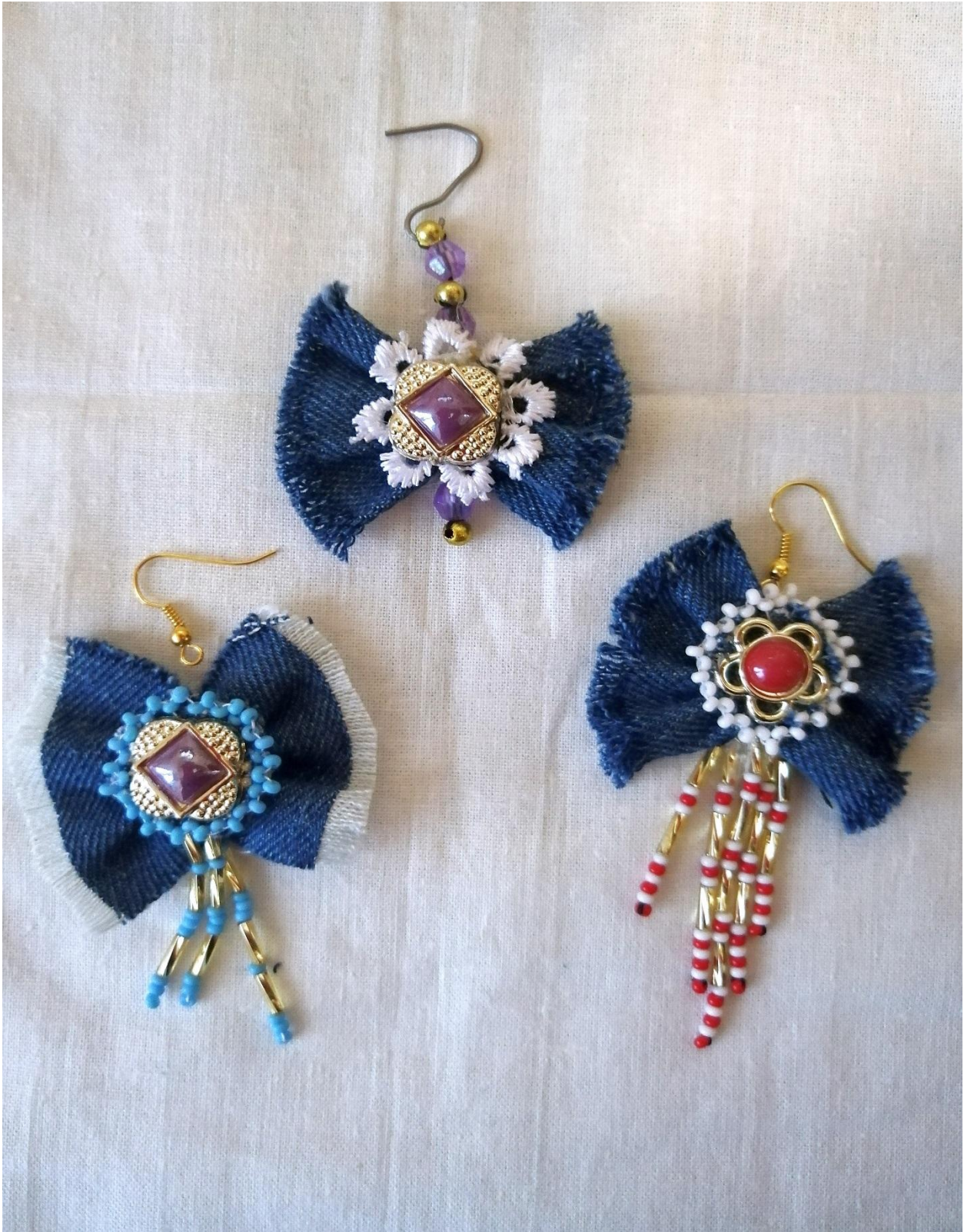
Украшение из джинсовой ткани «Серьги»